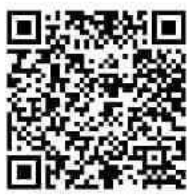
ใบสมัครรับเลือกตั้ง ส.ถ./ผ.ถ. 4/1

ทั้งนี้ สามารถศึกษารายละเอียดเพิ่มเติมได้จากพระราชบัญญัติการเลือกตั้งสมาชิกสภาท้องถิ่นหรือผู้บริหารท้องถิ่น พ.ศ. 2562 แก้ไขเพิ่มเติม (ฉบับที่ 2) พ.ศ. 2566 พระราชบัญญัติเทศบาล พ.ศ.2496 (แก้ไขเพิ่มเติมถึงฉบับที่ 14) พ.ศ.2562 หรือทางเว็บไซต์สำนักงานคณะกรรมการการเลือกตั้ง www.ect.go.th และสามารถขอทราบรายละเอียดเพิ่มเติมได้ที่สำนักงานเทศบาล หรือสำนักงานคณะกรรมการการเลือกตั้งประจำจังหวัดทุกจังหวัด หรือบริการสายด่วน 1444 หรือ Application Smart Vote